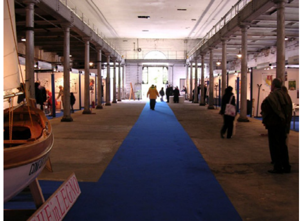
L'Arsenale attorno ai padiglioni di Navalis